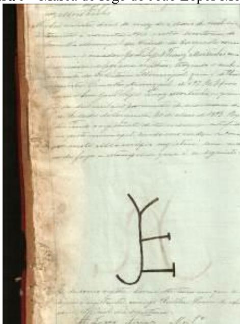
Figura 9 - Marca de fogo do João Lopes Moitinho