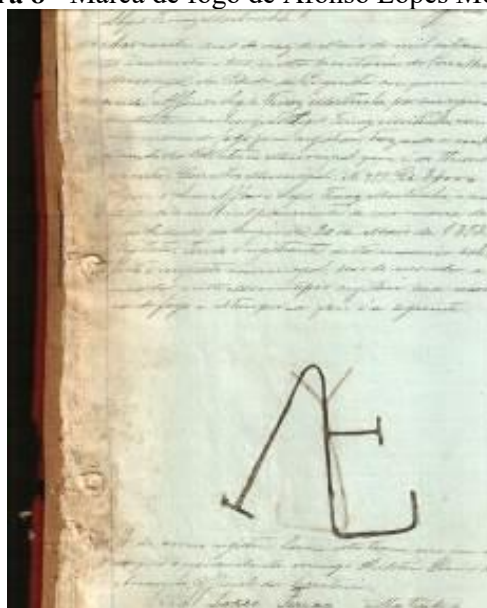
Figura 8 - Marca de fogo de Afonso Lopes Moitinho