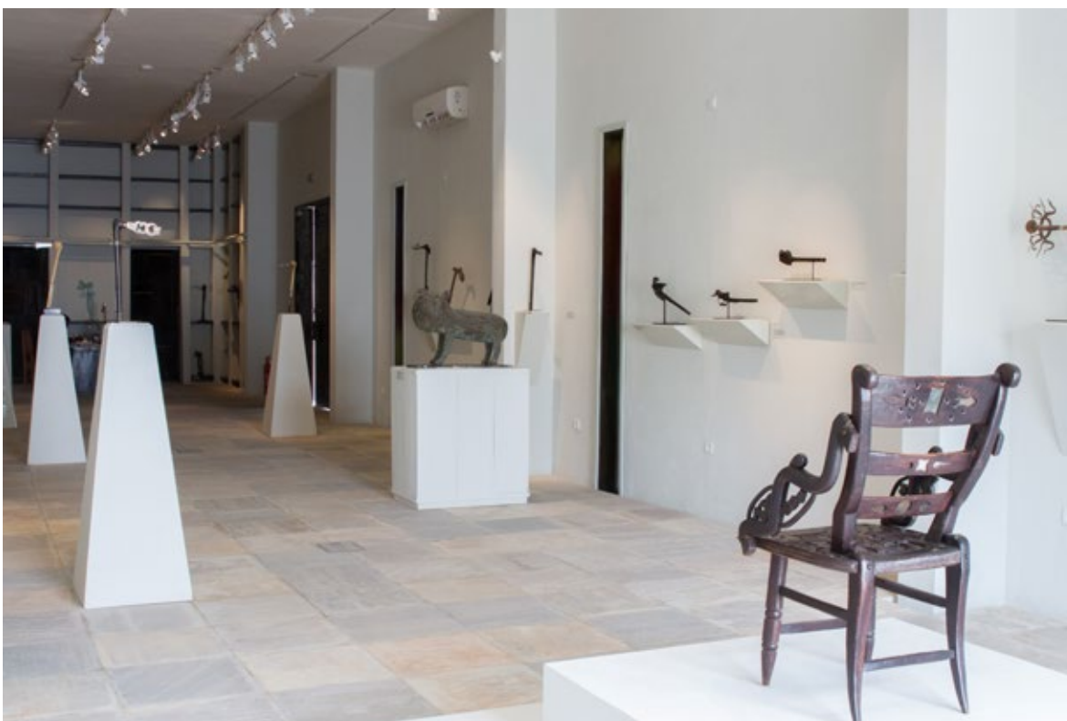
Il. 2. Le Petit Musée de la Récade, vista parcial

Além dos espaços criativos, o Centro possui salas de exposição, onde o público pode descobrir as obras criadas pelos moradores, e um espaço cênico para encontros e debates entre os atores do mundo da arte e o público. Essa abertura ao público é completada por um café, um espaço para a sociabilidade em um ambiente animado e mais íntimo.