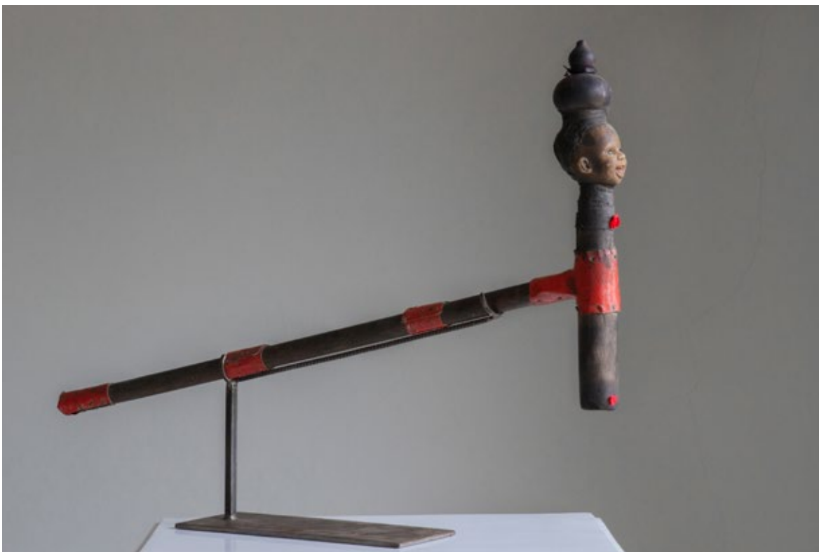
Il. 6. Gérard Quenum, Récade contemporânea, 2015. © Le Petit Musée de la Récade

as suas origens no Egito. Da mesma forma que as peças antigas que nos permitiram compreender a personalidade do soberano Fon representado, essas récades contemporâneas revelam a visão dos artistas locais sobre sua memória coletiva e sobre as principais preocupações sociais de nosso tempo.