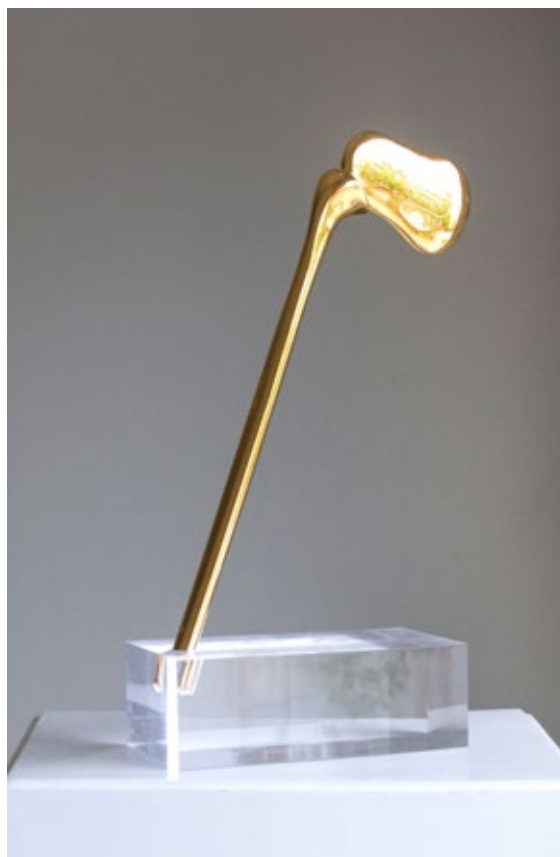
Il. 8. Kossi Aguessy, Récade contemporânea, 2015.