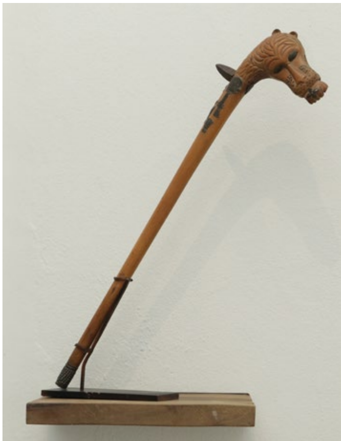
III. 4 Récade clássica