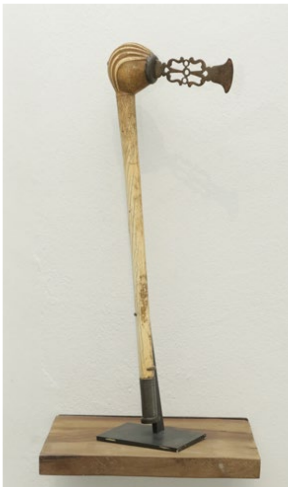
III. 5 Récade clássica

O mensageiro da corte (Huî-Sagu), que carregava a récade como atributo de sua função como representante do rei, desfrutava de imunidade, e sua pessoa era muitas vezes sagrada. Qualquer afronta a uma récade era considerada um desafio para o rei e era punida com a morte. A récade autenticava a mensagem transmitida verbalmente, mas acima de tudo servia como passaporte, uma credencial, para o portador. Quando o portador chegava ao seu destino, ele se agachava diante do destinatário da mensagem, retirava a récade de seu estojo de pano e a apresentava respeitosamente. Pelo emblema da récade , o interlocutor reconhecia o remetente; imediatamente ele também se agachava como sinal de deferência e escutava atentamente a mensagem do rei. A récade foi assim uma ferramenta de co-