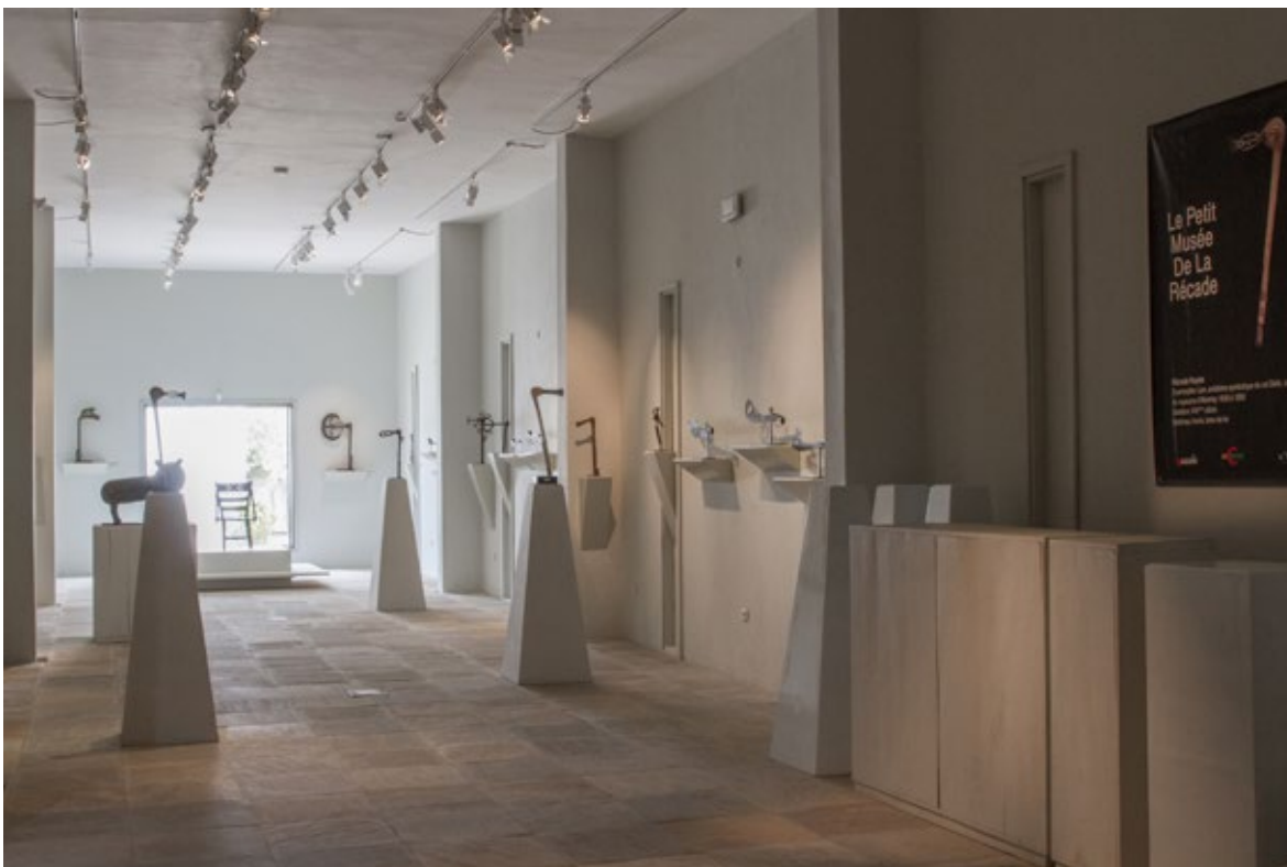
Il. 1. Le Petit Musée de la Récade, vista parcial