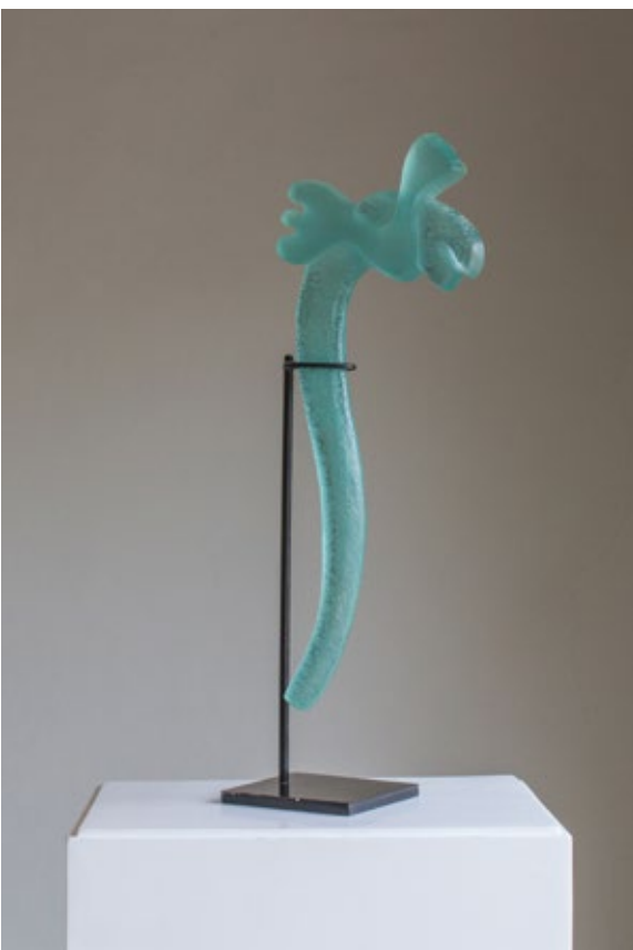
Il. 7 Zinkpe, Récade contemporânea, 2015.