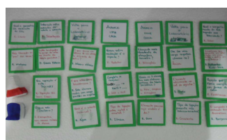
Figura 2. Fichas e pinos do quimicaleiro

As perguntas são relacionadas à Química Geral, Orgânica e Físico-química (Figura 2). Pode ser aplicado ao Ensino Médio e ao Ensino Superior, este brinquedo desperta nos alunos um interesse maior em saber as respostas, pois o intuito é vencer o jogo. Com isso, o objetivo se concretiza, há facilidade na aprendizagem do aluno, uma vez que, é uma forma eficaz e diferente de ensino.