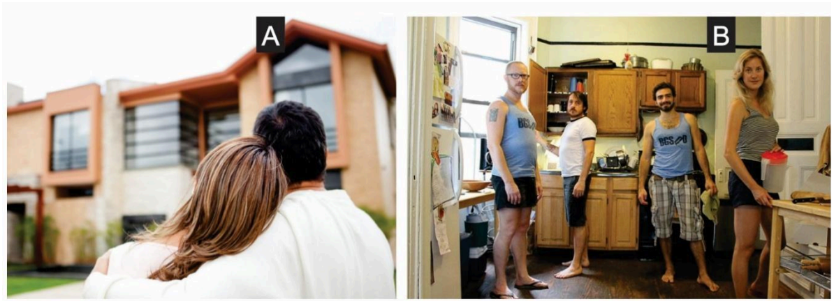
Figura 2: Relacionamentos, (não)monogamia e (des)apegos. [A] Vínculo monogâmico e o desejo da casa própria; [B] Alternativa não monogâmica e novos hábitos na moradia compartilhada.

como percepção de produtividade na trajetória de vida individual gera, simultaneamente, a incapacidade em descobrir a diversidade de acontecimentos e lugares a serem desbravados fora de seus territórios de origem.