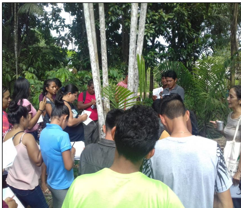
Figura 2: Registro da aula sobre nomes de plantas e suas partes

aula foi a própria aldeia e a variedade de plantas estudadas foram as encontradas na natureza que cerca a aldeia.