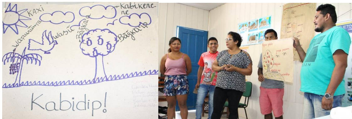
Figura 4. Exemplos de relatórios pós-tarefa.

Após a realização das tarefas, os alunos frequentemente apresentavam seus resultados, o que lhes proporcionava a oportunidade de refletir sobre a experiência vivenciada e de receber feedback . Esse retorno era oferecido tanto pelo professor Mundurukú quanto pelos próprios alunos, podendo incidir sobre aspectos comunicativos e/ou formais da língua. A ilustração na Fig. 4 mostra um exemplo de apresentação pós-tarefa. Nela já encontramos tanto o vocabulário estudado quanto acréscimos de outros itens lexicais, como kabikerere 'nuvem' e kaxi 'sol', revelando que eles procuram preencher as lacunas, colaborando uns com os outros (PM 9 – aprendizagem colaborativa).