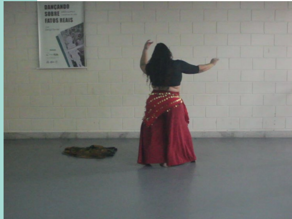
FIGURAS 6 E 7

A cena final – com mãos dançantes e rosto velado (seja pelo tecido, cabelo ou posicionamento de costas) desafia estereótipos sobre a dança do ventre, afirmando-a como prática ancestral e política.