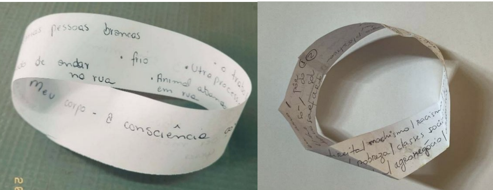
FIGURA 2 Meu corpo – a consciência corporal que fiz em mim Várias pessoas brancas – Ter medo de andar na rua O trabalho / Ultraprocessados Animais abandonados na rua Quase todos os homens Frio / Ser molhada na rua por chuva sem querer Não poder dormir quando quer.

Nas oficinas, as experiências pessoais de ordem pública, e vice-versa, escritas na fita de Möbius, tornaram-se um gesto material simbolizando aquilo que move toda a proposta: uma dança entre dentro e fora, entre memória e fabulação, entre arquivo e invenção.