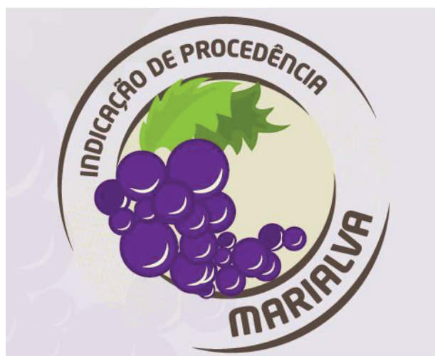
Figura 2 – Selo de Indicação Geográfica da Uva Marialva