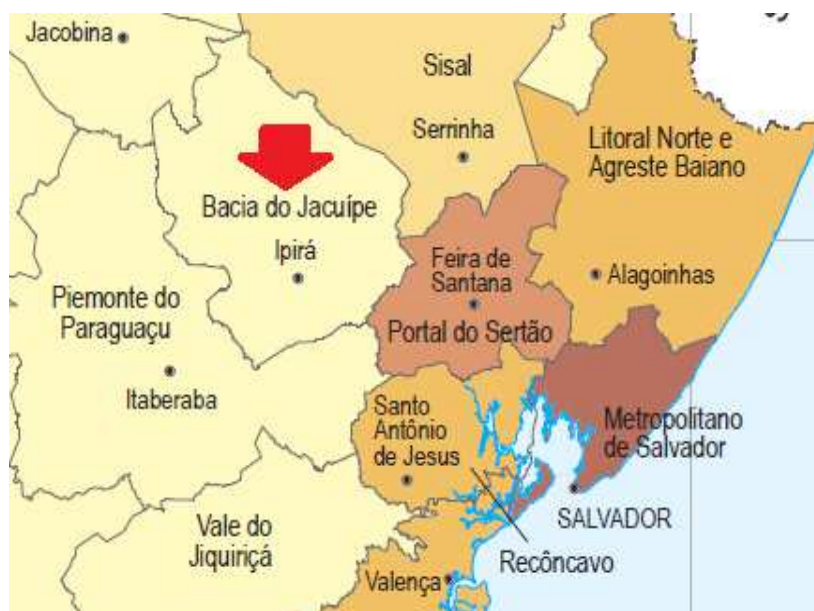
Figura 1 – Município de Ipirá

A pesquisa está delimitada ao município de Ipirá, o qual está situado no território de identidade da Bacia do Jacuípe, conforme recorte do mapa do estado da Bahia (Figura 1), dividido por territórios de identidades, extraído do site oficial da Superintendência de Estudos Econômicos e Sociais da Bahia (SEI).