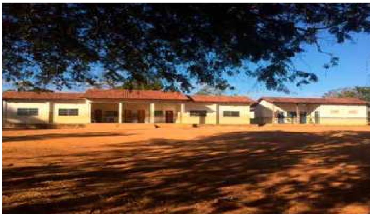
Figura 3 – Imagem atual da Escola Indígena Wakômêkwa

Dessa maneira, as comunidades escolheram Riozinho Kakumhu por regionalmente estar centralizada entre as outras e ser de fácil acesso às comunidades atendidas. O professor Edimar Xerente relata que a escola iniciou suas atividades de forma bem precária, utilizando uma estrutura de barro e de palha como sala de aula, após alguns anos, a primeira etapa da escola em alvenaria e mais estruturada foi construída em 2007, já a segunda etapa, caracterizada pela sua ampliação, foi realizada em 2009, e, atualmente, a escola possui duas salas de aula; dois banheiros, uma cozinha e uma sala de computação com três computadores.