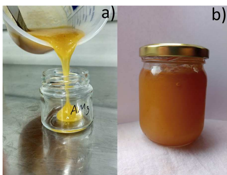
Figura 1 – Consistência final (a) e produto final (b) da geleia de cupuaçu