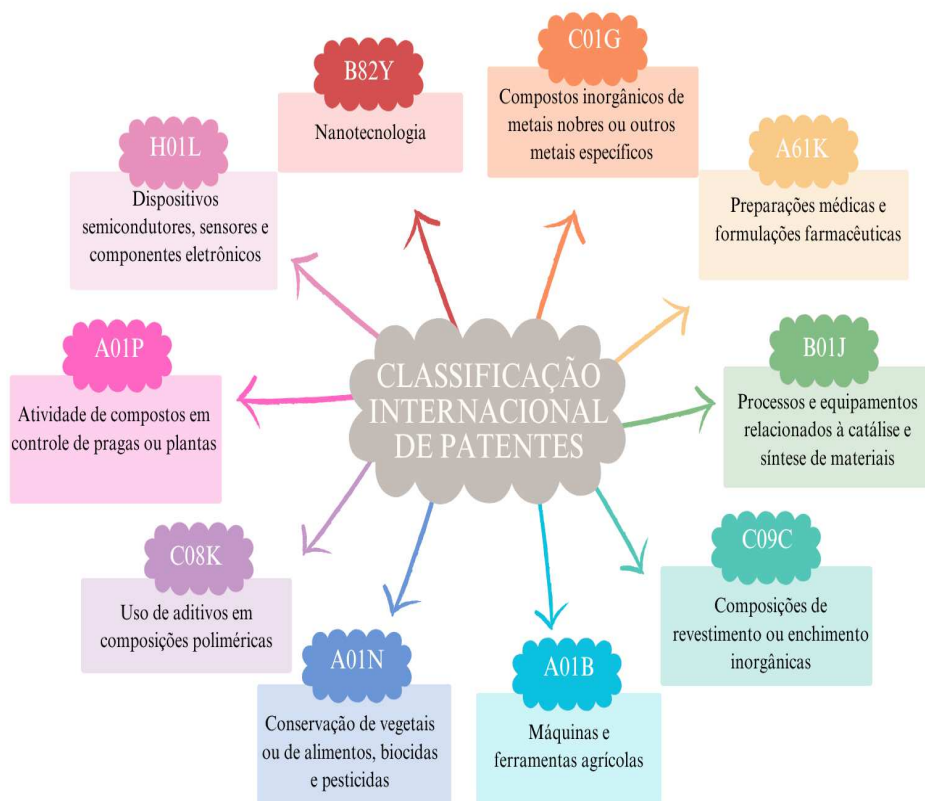
Figura 3 – A CIP das invenções investigadas