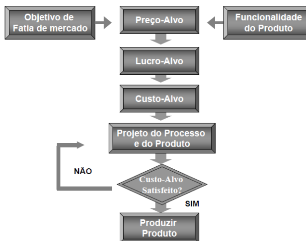
Figura 1 - Modelo de Custeio-Alvo

Como pode ser observado na figura 1, inicialmente o objetivo é atingir as necessidades dos clientes e o foco da empresa está nos produtos funcionais e preços competitivos. Em seguida é definido o custo a ser atingido e se o mesmo não for atingido, o processo retorna para a fase de projeto.