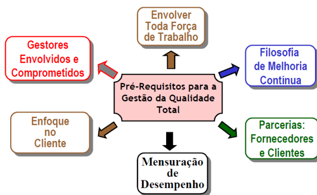
Figura 2 - Relações entre Gestão e Custeio da Qualidade

Um produto de qualidade é aquele que satisfaz as expectativas do cliente e a qualidade vem se tornando uma dimensão competitiva importante para as organizações. As empresas estão implantando programas de melhoria da qualidade e segundo Hansen e Mowen (2009), surge a necessidade de monitorar e relatar o progresso desses programas. Os gestores precisam conhecer seus custos de qualidade e como estes estão mudando no decorrer do tempo.