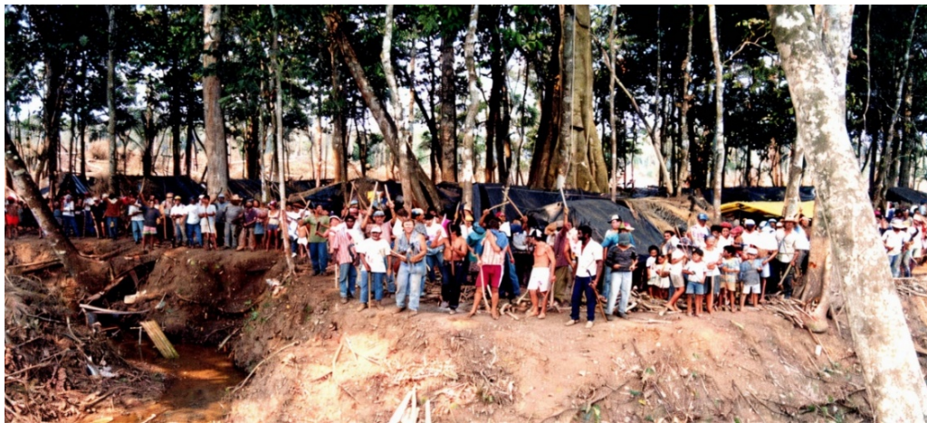
Camponeses acampados na Fazenda Santa Elina durante a entrega da ordem judicial de reintegração de posse, em 14 de julho de 1995.

que antes estava nas mãos do latifúndio, em roça coletiva. Organizaram escola, autodefesa, cozinha coletiva, comissão de saúde etc.