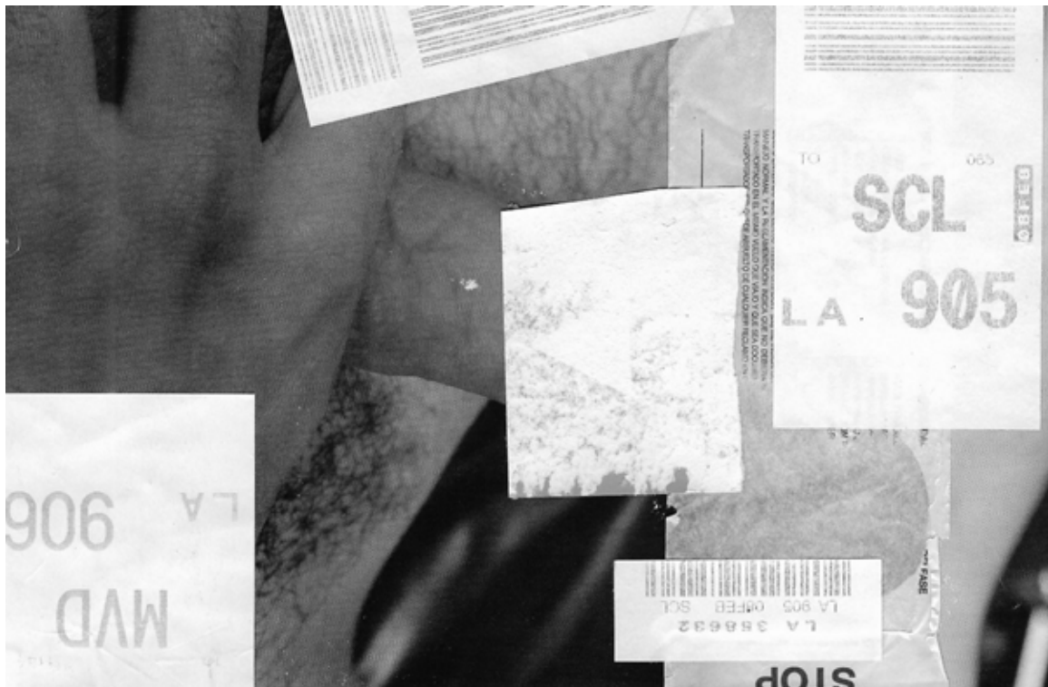
Imagem 6. Voo Solo 6, colagem manual digitalizada e editada, 2024.