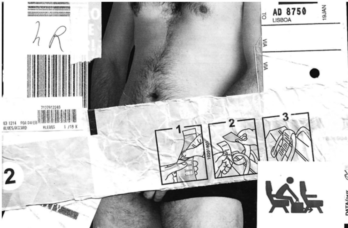
Imagem 5. Voo Solo 5, colagem manual digitalizada e editada, 2024.