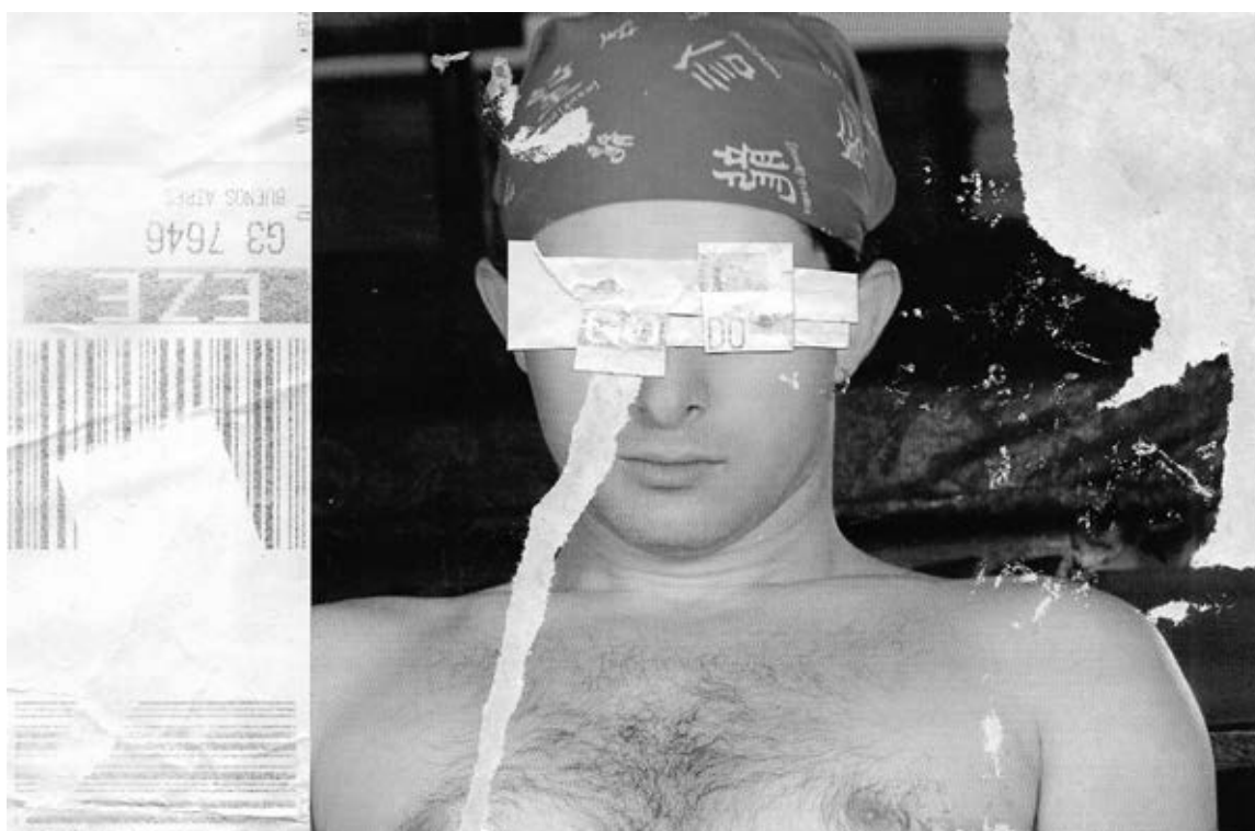
Imagem 4. Voo Solo 4, colagem manual digitalizada e editada, 2024.