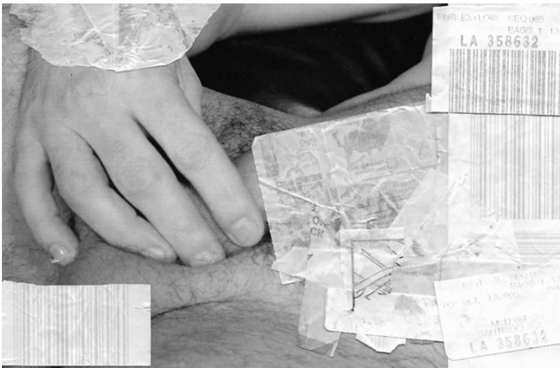
Imagem 2. Voo Solo 2, colagem manual digitalizada e editada, 2024.