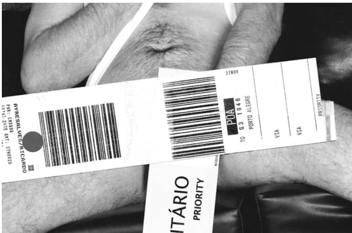
Imagem 7. Voo Solo 7, colagem manual digitalizada e editada, 2024.