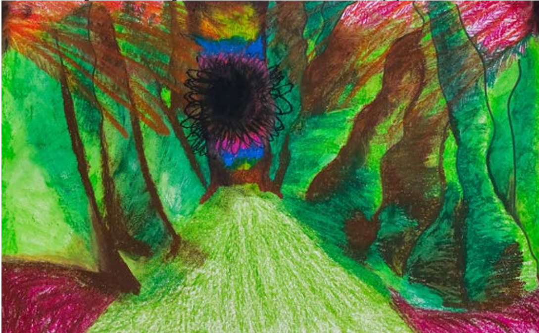
Figura 3: Luz Negra no fim da Mata, Cera à óleo sob papel A3, 2023

Experimentar memórias visuais no papel foi algo que em terapia foi muito incentivado, pois a minha imaginação já é bastante visual e, apesar disso, há imagens que eu não consigo construir pois não consigo entendê-las ainda. Estou conjecturando hipóteses de aceitar as não-imagens, o não-imaginado, aquilo que habita fora do alcance humano. Para isso, elementos da espiritualidade, da física e da vida em si estão participando das minhas experimentações.