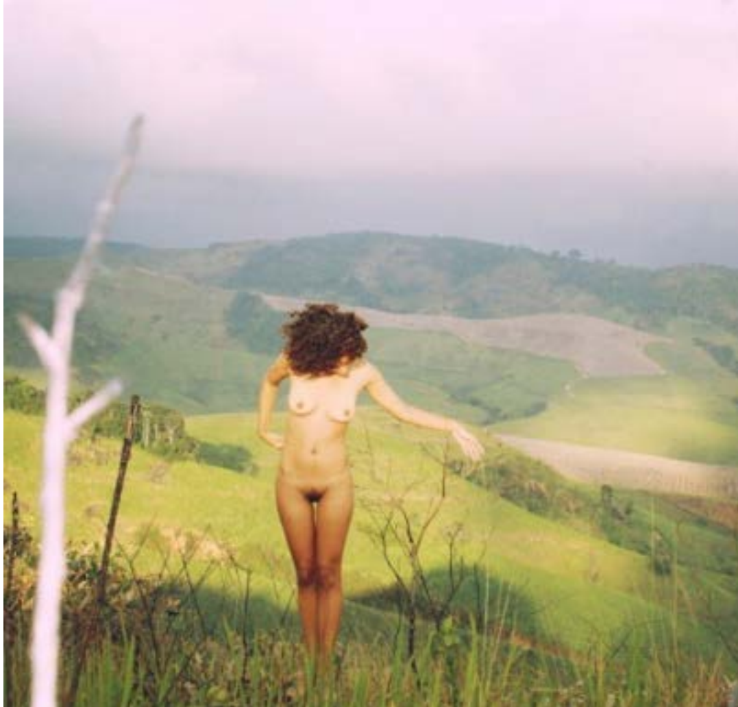
Figura 1: Foto-Performance na Pedra do Arroz/Pimenta em Jussaral (PE), meados de 2016.