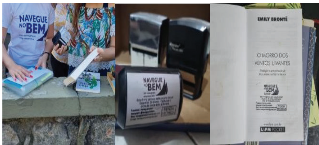
Figura 1 – Curadoria dos livros em uma edição do Escambo de Livros, detalhe do carimbo e imagem de um dos livros do acervo com o registro do carimbo

Ao longo de uma década de atuação contínua, foram realizadas 53 edições do Escambo de Livros em múltiplos espaços da cidade de Salvador, incluindo parques, praças, bibliotecas públicas, Organizações Não Governamentais (ONGs), estações de metrô, escolas e universidades públicas estaduais e federais. Essa trajetória demonstra a robustez e a adaptabilidade da proposta. A dinâmica central do projeto consiste na troca de livros: o participante entrega suas obras, que passam por uma avaliação da equipe de curadoria. Se aprovados (considerando critérios como estado de conservação e pertinência ao escopo do projeto), os livros são carimbados, conforme a Figura 1 apresentada a seguir. Trata-se de medida para desencorajar a revenda em estabelecimentos como sebos.