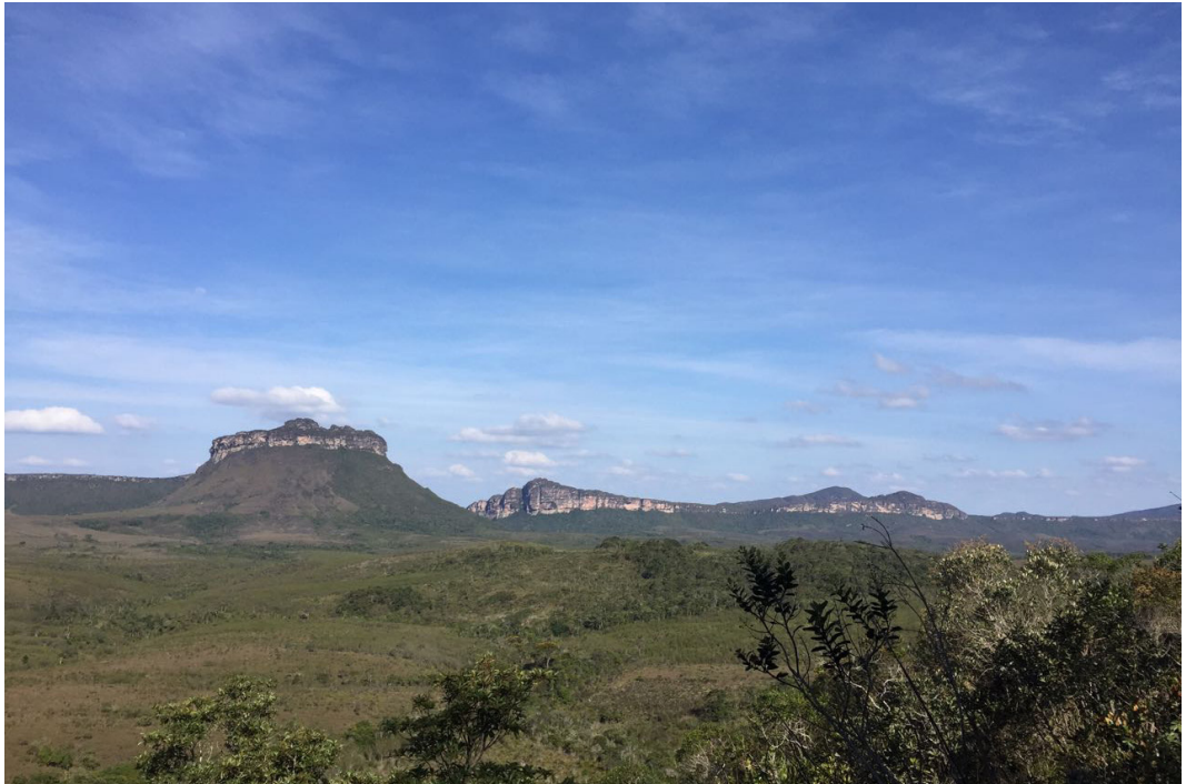
Vista do Vale do Pati