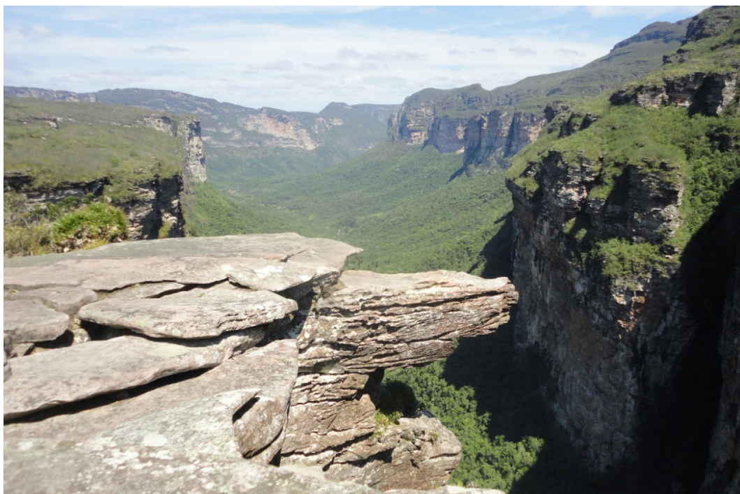
Vista do Vale do Pati