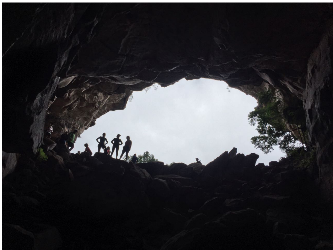
Gruta do Morro do Castelo no Vale do Pati