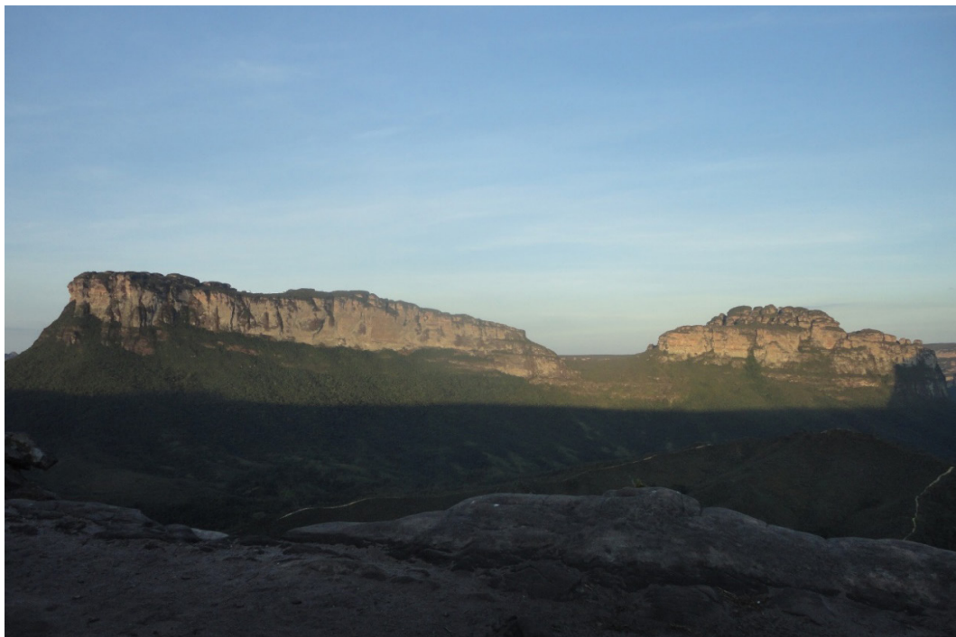
Vista do Vale do Pati