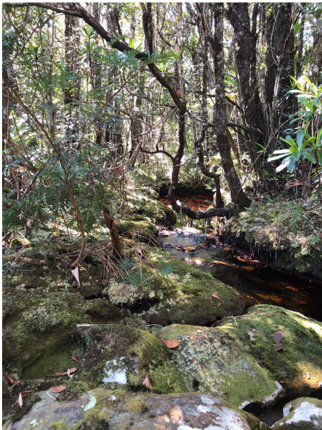
Trilha do Vale do Pati