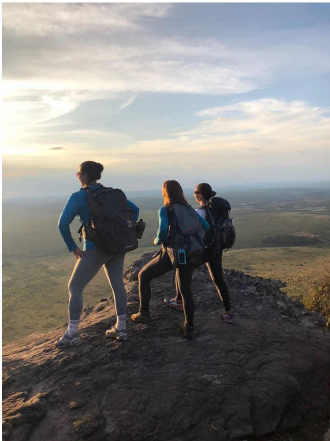
Trilheiras no Vale do Pati