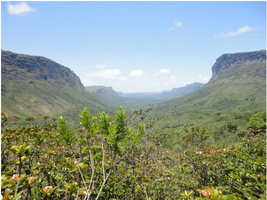
Vale do Pati

Assim é o Vale do Pati: um pedaço de mundo onde a natureza fala mais alto e onde o humano aprende, de novo, a ouvir.