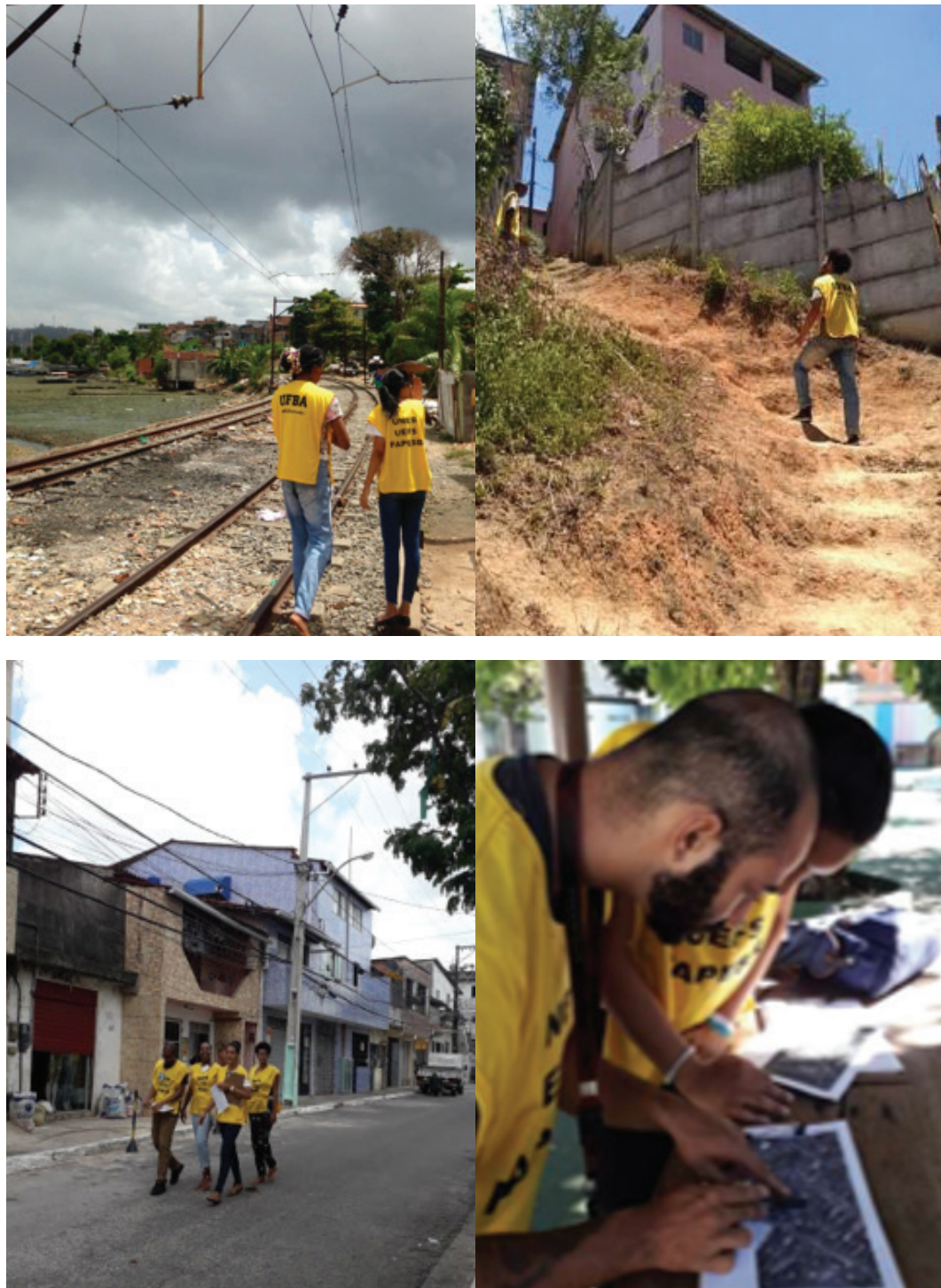
Figuras 5, 6, 7 e 8 – Pesquisadores em campo na fase da aplicação dos questionários.