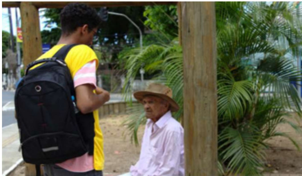
Figuras 1 e 2 – Divulgação da pesquisa de campo.