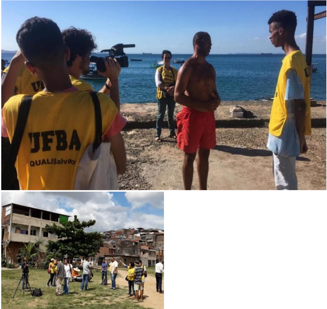
Figuras 3 e 4 - Entrevistas para o documentário.