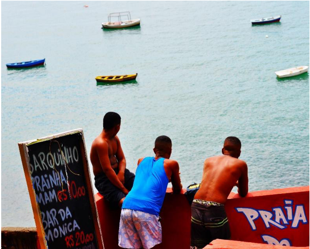
Prainha do Museu de Arte Moderna – MAM. Enseada localizada no Parque do MAM

A essas, somam-se iniciativas como hortas comunitárias, escolas populares, coletivos culturais, mutirões habitacionais e plataformas digitais colaborativas, que operam como formas de reapropriação do espaço e produção de novas territorialidades. Essas expressões de resistência não apenas contestam a lógica dominante, mas também criam alternativas concretas e cotidianas à urbanização excludente e ao esvaziamento das relações sociais promovido pelo capital.