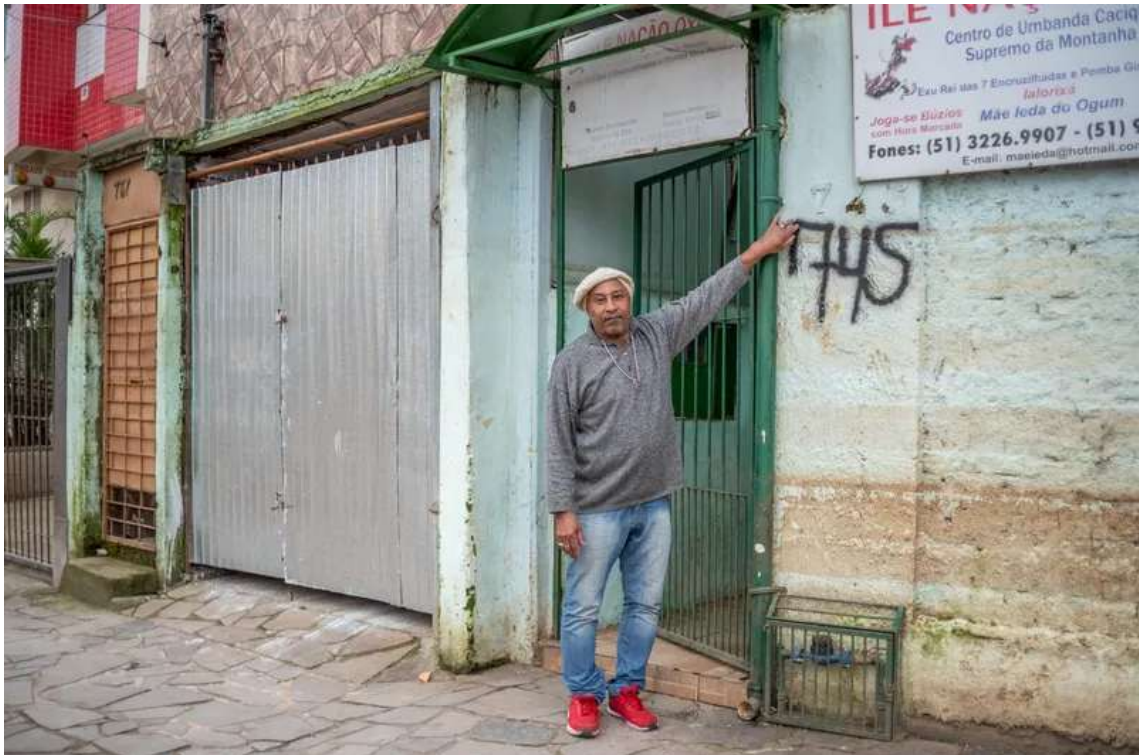
Figura 5: A água passou de 1,5 metros de altura e uma sala pequena abriga as imagens que não foram destruídas.

povo negro, continuou pulsando na localidade, pois quando da retomada foi realizado um mutirão, onde os filhos da casa reergueram o espaço. Abaixo, na figura 5, percebemos o nível que a água atingiu, demonstrando o expressivo impacto das águas para o terreiro.