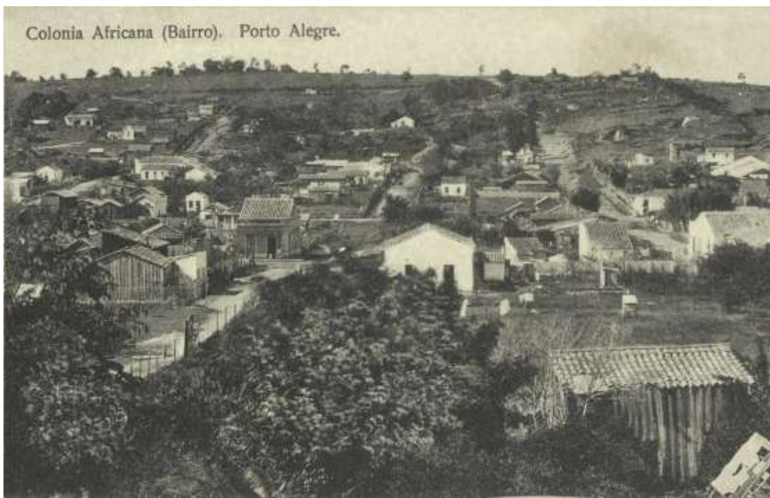
Figura 3: Vista parcial da Colônia Africana em torno de 1910, atual bairro Rio Branco.

Esses territórios expressam uma trajetória que se inicia com o período escravocrata, segue com a reorganização das populações negras após a abolição e chega ao presente, tensionado por políticas urbanas excludentes e processos de gentrificação. Identificá-los é, simultaneamente, reconhecer as raízes africanas que estruturam a cidade e denunciar os mecanismos que continuamente ameaçam sua existência. Na figura 3, percebemos o bairro conhecido como Colônia Africana, localidade que demonstra um dos espaços ocupados pela população negra.